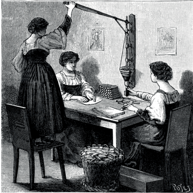
TREBALLADORES ELABORANT CARTUTXOS

els cabells de vermell i se'ls menjava les ungles produint-los dolor als dits tot el dia.